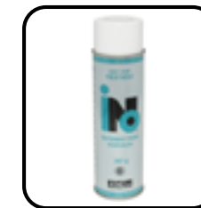
Traitement pour vadrouille INO Solutions