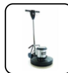
Polisseuse basse vitesse