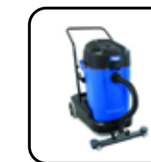
Aspirateur sec & humide