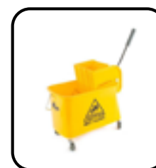
Chaudière seau-essoreuse pour décapant