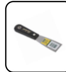
Couteau à mastic