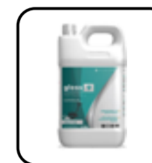
INO Gloss 9, décapant à plancher INO Solutions