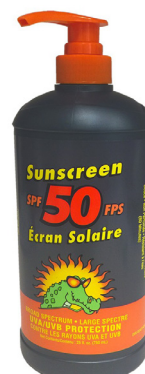
DEG-12390 750 ml