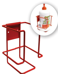
Deg-12100 Support mural